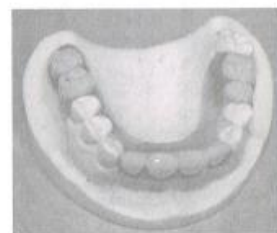
周囲の歯にやさしく、目立たないミラクルフィット。

よしはら歯科クリニックでは、ミラクル入れ歯以外にも、軽くしなやかな特殊樹脂を使用した「ウエルデンツデンチャー」や歯根に取り付けた磁石の力で入れ歯をしつかり固定させる「磁性アタッチメント」、床を薄くし、味をしつかり感じられる「金属床入れ歯」など、多くの